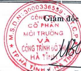
Nguyễn Duy Bằng

(Các thuyết minh từ trang 06 đến trang 26 là bộ phận hợp thành của Báo cáo tài chính này)